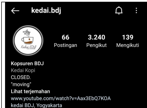
Instagram Kedai BDJ

Beberapa waktu terakhir di Yogyakarta berkembang dengan pesat Bisnis kuliner, Sebagai contoh dalam produk minuman kopi, dahulu orang hanya mengenal kopi hitam dengan campuran gula, susu atau coklat, sekarang variannya lebih banyak lagi. Ada yang dicampur vanilla, alpokat, arang dan gula aren. Selain kopi, berkembang pula minuman lain seperti teh, coklat, bubble drink, keju dan boba. Seiring berjalannya waktu, ide-ide kreatif dalam bisnis kuliner akan terus bermunculan baik dari pebisnis baru maupun lama (Romero, 2019). Salah satu bisnis yang berjalan dengan system hybrid dengan online dan offline adalah Kedai BDJ yang beralamatkan di Jl. Patih Singoranu Yogyakarta. Owner dari bisnis tersebut adalah Mazi Nurazmi. Selain itu, Mazi juga memiliki kedai ditempat lain di Cirebon yaitu Kecuali Coffe yang dijalankan dengan konsep Hybrid. Selain itu kecuali Coffe juga menyediakan produk yaitu “ ngopi dari rumah ” yang menjadi salah satu strategi untuk mendekati pasar melalui media komunikasi digital.